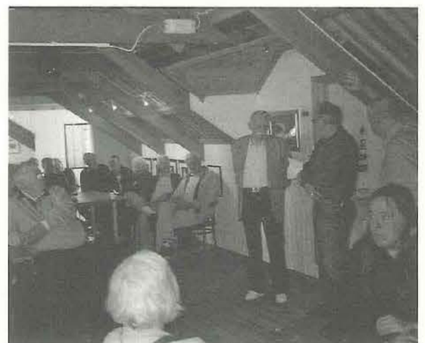
Galleri Geitodden var et utmerket sted for kaffe og orientering.