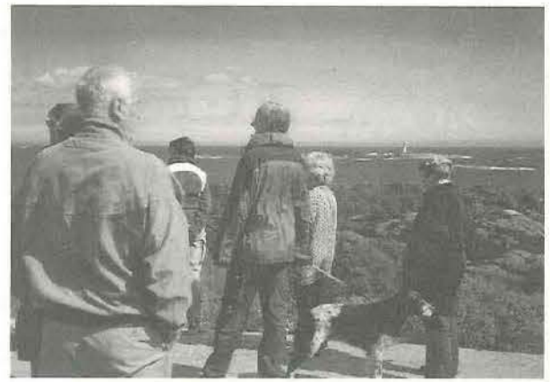
Fra Gråheia har en rikt utsyn over holmer og skjær.