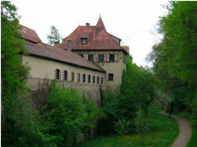
Her var kjelebanen hvor St Peter spilte kjeglespill i kap 11 i Det gyldne evangelium.

Det grønne tårn er et utkikkstårn. Men i Det gyldne evangelium er det et fengsel der Sankt Peter kom fordi han var på pub hvor han vant alle rundene i et kjeglespill, noe som gjorde at de trodde han var fanden. Derfor kastet de ham i fengselet.