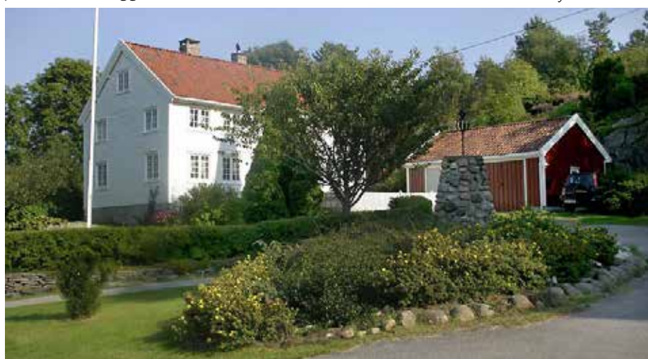
Scott-varden utenfor Høvåg Kirke.