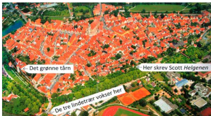
Dinkelsbühl (bilde fra ei bok)