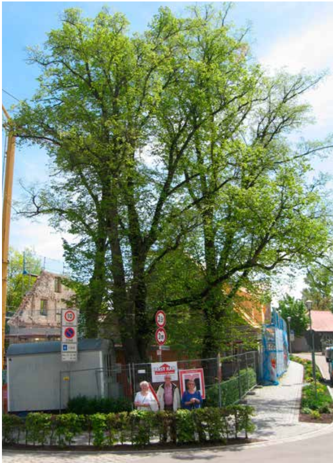
De tre lindetrær som har gitt navn til Gabriel Scotts bok med samme navn.

I 1907 skrev Gabriel Scott også De tre lindetrær som er en romantisk bok om venninnene Trude, Maria og Elisabeth som alle var forelsket i Didrik, som dessverre druknet i elva. De tre lindetrærne som har gitt boka tittelen står fortsatt like utenfor bymuren, men i boka er de plassert utenfor Elisabeths hus langt ute på en slette. I år er her byggeplass med ei heisekran og containere, men når huset bak lindetrærne er renoverert kommer sikkert romantikken tilbake.