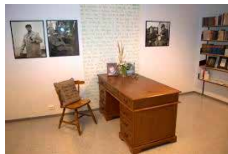
Scottrommet på biblioteket