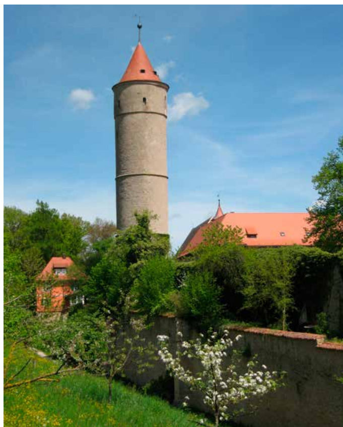
Det grønne tårn.