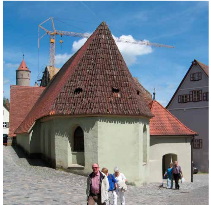
Hellige tre kongers kapell som vi kan lese om i De tre lindetrær. I bakgrunnen skimter vi Det grønne tårn.