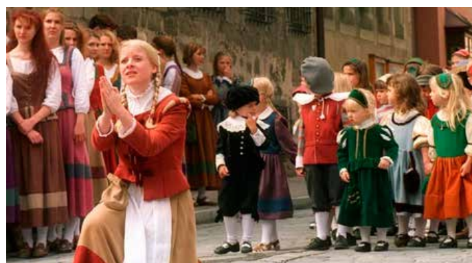
Det er veldig stas å bli valgt ut til å spille årets Kinder-Lore.

Det er i følge et skuespill fra 1896 det skjedde slik, så sannhetsgehalten må kanskje tas med en klype salt. Men i alle fall er det slik historien dramatiseres ved den årlige festen Kindersezeche som har vært feiret siden 1897.