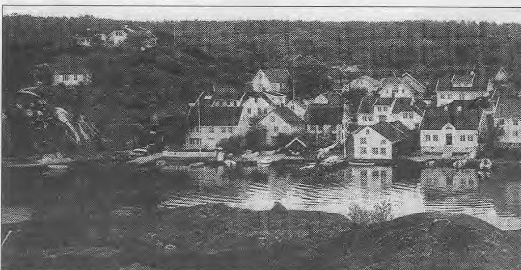
Brekkestø sett fra Gaupholmen. Gabriel Scott leide ofte rom på gjestgiveriet (huset med kvist midt i havna). Her fant han inspirasjon til flere av sine bøker, bl.a. «Kilden» og «Skipper Terkelsens levnedsløp».

Også i år kan vi by på et rikholdig program med konserter, foredrag, godbiter fra Agder Teater, god mat, familieaktiviteter, opplesning, gudstjeneste, båttur, guidet tur og auksjon.