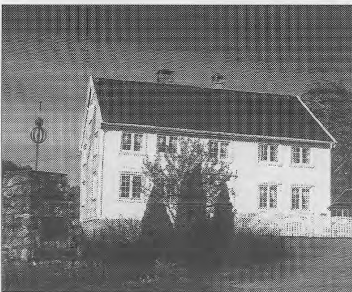
Den gamle prestegården hvor Gabriel Scott først bodde da familien kom til Høvåg. I forgrunnen ses minnesmerke over Gabriel Scott.