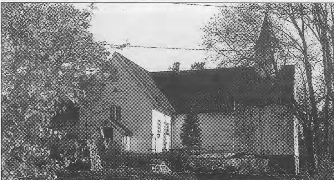
Høvåg kirke er en middelalderkirke fra ca. 1180, trolig plassert nær et gammelt tingsted og gudehov. Kirken omtales i flere av Gabriel Scotts bøker.