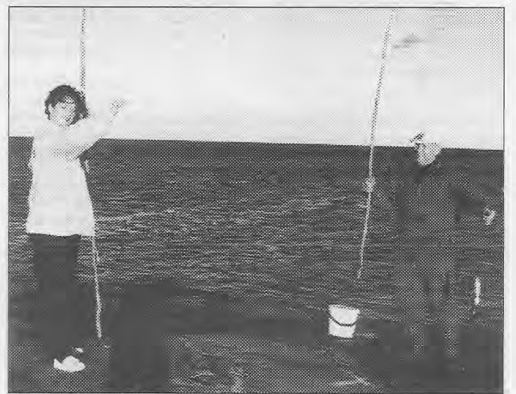
Berggyltfiske på Fladaneskjær.

«Det beste agnet at fiske med faar en av fotstøt til smaakrabben. Det brækkes op i passende stykker og er et aldeles patent agn, som er som det er gjort for kroken og dertil sitter godt og fast paa. Det siste især er en nyttig egenskap, da bergnæbben som jo er alle steder og mest der, som den ikke skulde, da bergnæbben vanskelig faar det av kroken om den nøkker aldrig saa flinkt. En kan ogsaa bruke en liten pilk, som en rykker frem og tilbake med stangen. Den falder ofte svært i smak, men vil gjerne sætte sig fast i bunden, om en er litt grand uforsiktig. Stangen maa være lang og litt stiv og snoret og for-tømmen av beste sort. Bergylten følger nemlig ikke godvillig med, men lægger siden til og holder igjen - iblandt gaar den ogsaa ind i uren og prøver at gnure kroken av. Er det en riktig rusk av en fisk, kan det tit staa et helt basketak, inden en vinder at vippe den op.»