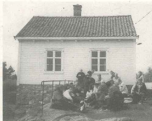
Kaffepause utenfor skolehuset