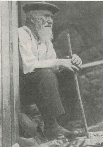
Fiskeren Markus.

Men fiskeren Markus er for denne verdens store så uanselig som et rugaks i veigrøften. De som bor i kolossale hus og har ferdig oppvarmede rugehyller til enhver tid, tror ikke sine egne øyne når de oppdager den fyrstikkensken fiskeren Markus bor i, der han bøter sine garn, koker sin kaffe og tenker sine tanker. Og mens han gjør det, har vi gått og passet skrotten. Hver dag har vi vært påpasselige med den, det har vært skrotten først og skrotten sist, den har tatt nakketak på oss og tvunget oss dit den ville. Den har vært vår slavedriver og ikke gitt oss levende fred, den er en slukhals en fråtser og en øde-land fremdeles, og setter med sin grådighet farlige krefter i sving. Det er ingen krig, intet mord uten på kroppens befaling, og allikevel er den ingen verdens ting av seg selv, den må ha sin daglige støtte, fylles med kraft fra solen for å holde seg oppreist og gående,