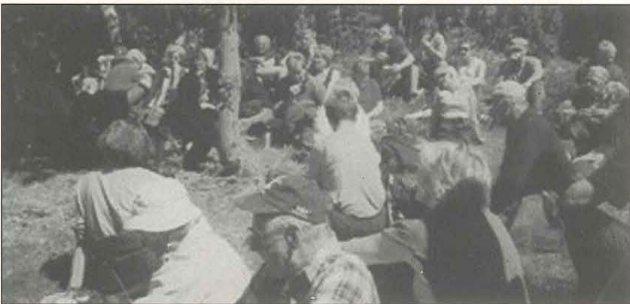
Folk koser seg i det fine været.

Hvordan livnærte folk seg på en slik plass? De holdt husdyr, dyrket litt korn og etter hvert poteter. De tok jobber på gårdene i nærheten - og barkefletting, ved- og tømmerfløting ga også inntekt. Likevel må det ha vært et ytterst strevsomt liv her inne i skogen.