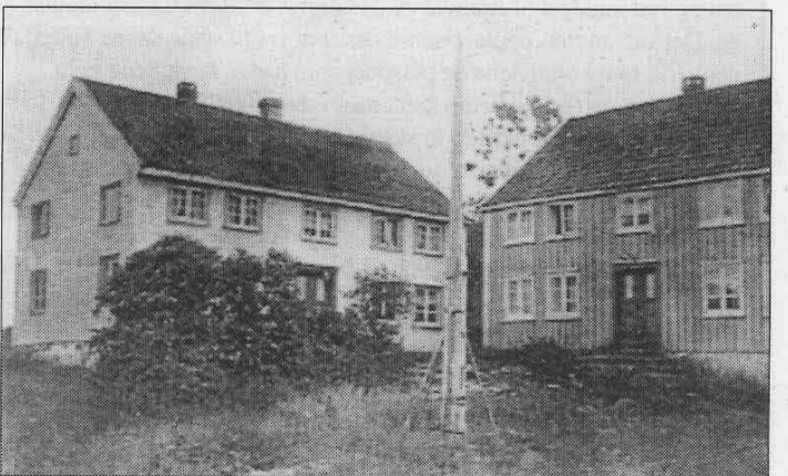
Gammelt foto av Høvåg gamle prestegård. Ved siden lensmannsgården som i 1950-årene ble flyttet nærmere Kirkekilen.